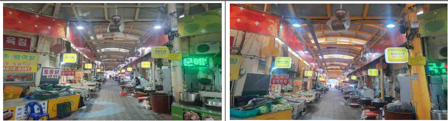
아케이드 기둥 및 내부 도색 (전 → 후)