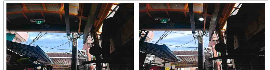
LED 전구 교체 사업(전 → 후)