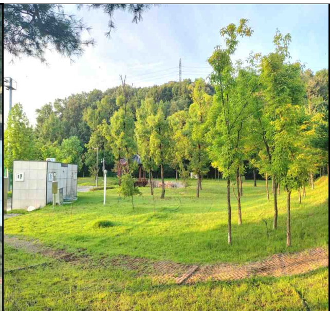
율곡동 939 일원(도로공사 뒤 안산공원 부지)