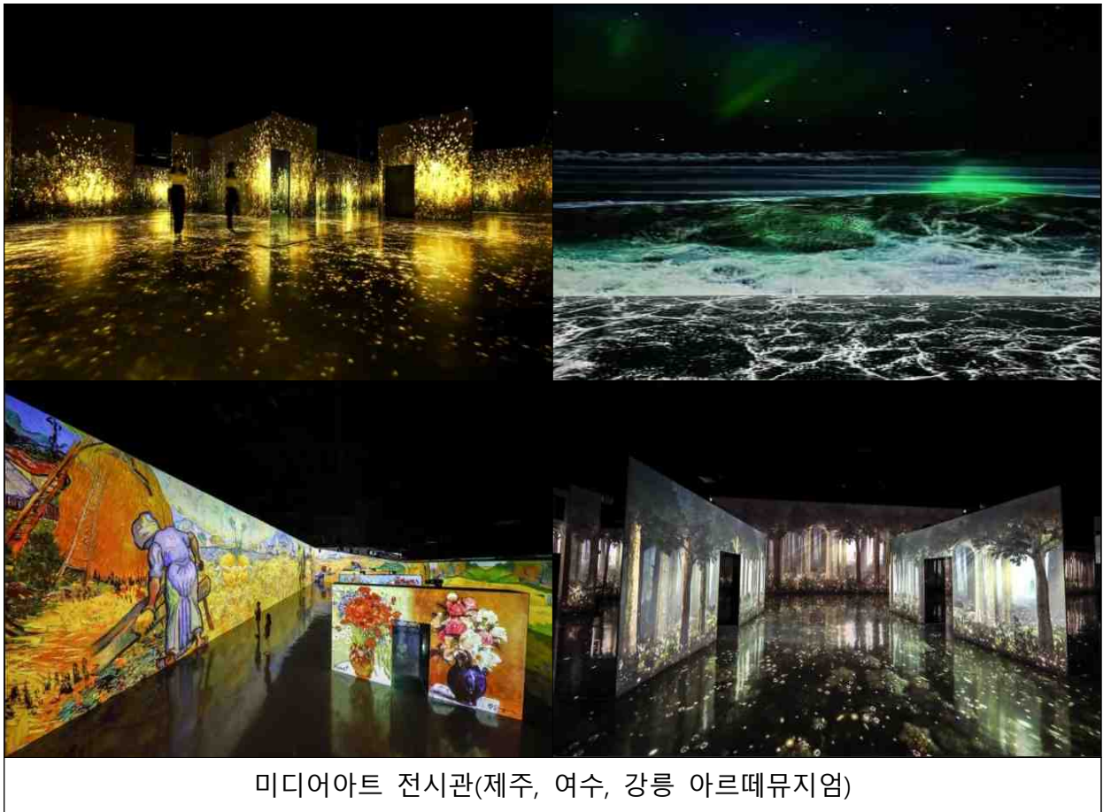
미디어아트 전시관(제주, 여수, 강릉 아르떼뮤지엄)