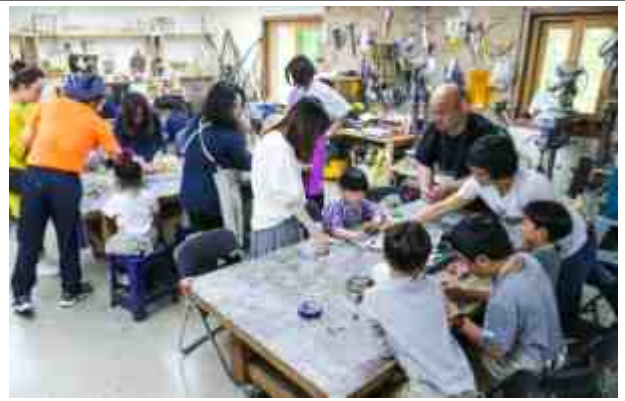
공방(예술 교육 시설)